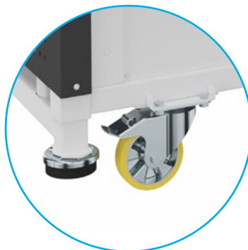
Fahrbar dank Schwerlastrollen