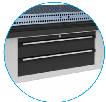
Schubladen für Werkzeuge